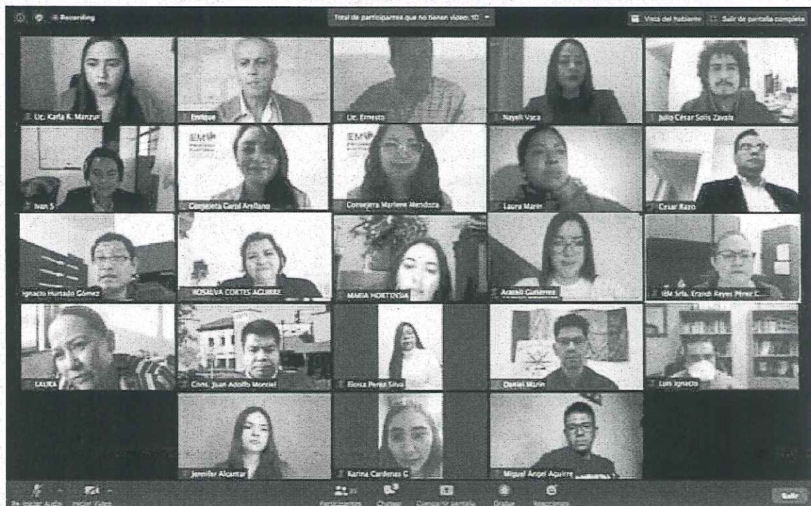
Sesión de Instalación de los Observatorios Ciudadanos del Ayuntamiento de Hidalgo y Poder Ejecutivo del Estado.

Ambos Observatorios Ciudadanos tendrán un periodo de vigencia de dos años de conformidad con el artículo 53 de la Ley de Mecanismos.