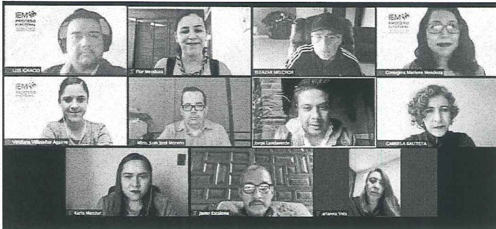
Capacitación sobre Mecanismos de Participación Ciudadana a la Asociación Civil Despierta Contepec.

Finalmente, se procedió a contestar las preguntas y dudas de los asistentes, sobre el trámite de algunos de los mecanismos de participación.